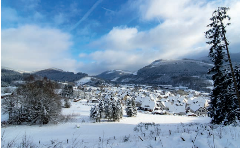
Winter 23/24: Einige Tage mit sehr viel Schnee