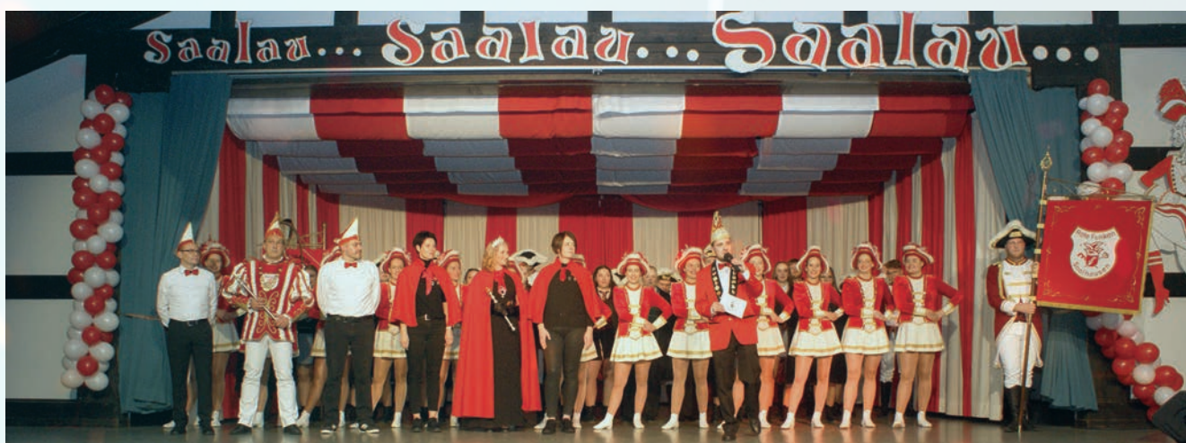
Sessionseröffnung November 2023

Das Highlight des Abends war zweifellos der Auftritt der Kölschen Band „Veedel for 12“, die mit ihrer mitreißenden Musik und ihrem rheinischen Charme für ausgelassene Stimmung sorgte. Nach dem Programm heizte DJ Gonzo der Partymenge ein.