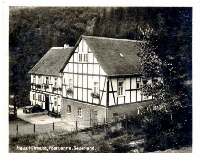
Haus Hilmeker 1924