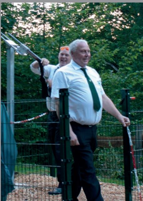
... der Moment ...