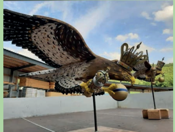
Die ausgestellten Vögel

In den Jahren zuvor fand die „Vogelschau“ – das Ausstellen der fertig hergerichteten Schützenvögel – parallel in der Werkstatt der Vogelbauer statt. Im letzten Jahr wurden diese beiden vereinsinternen Vorbereitungen auf dem Gelände von Stinanz abgehalten.