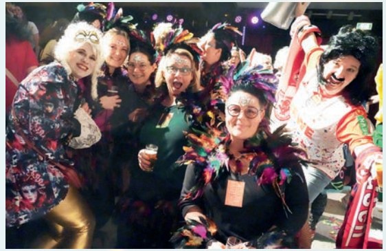
Bunt und nix für Männer

Bereits ab 15:11 Uhr strömten die verrückten Weiber in die ausverkaufte Halle. Um 16:30 Uhr öffnete sich der Vorhang der in liebevoller Kleinarbeit gestalteten Bühne. Die Stimmung der närrischen Weiber war von Minute eins an fantastisch. Das bunte und spritzige Programm bot eine Vielzahl an Highlights: Die Gardetänze des Tanzpaares aus Saalhausen, die Auftritte der Funkengarde und der Prinzengarde Saalhausen, der Prinzengarde Bamenohl und der Schützengarde Finnentrop, die Darbietung der Männercombo „Talentfrei“ Welschen-Ennest, die Showtänze der Funkengarde Saalhausen und „Eight after six“ sowie humorvolle Showeinlagen.