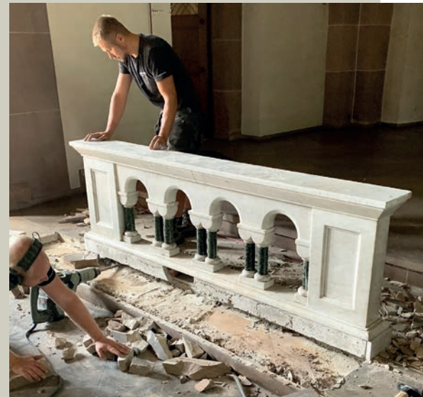
Demontage der Kommunionbank