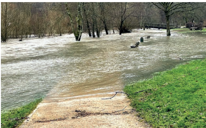
Seenplatte Kurpark