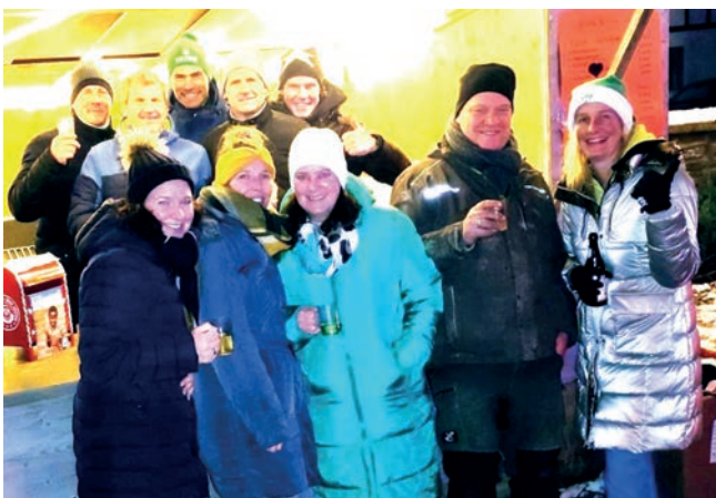
Das Organisationsteam des Weihnachtsmarkts und Besucher

Am 1. und 2. Dezember 2023 fand nach vier Jahren erneut der örtliche Weihnachtsmarkt „Adventszauber am Hof“ in Saalhausen statt. Trotz niedriger Temperaturen und klirrender Kälte versammelten sich zahlreiche Besucherinnen und Besucher, die mit viel Glühwein für eine warme und festliche Atmosphäre sorgten.