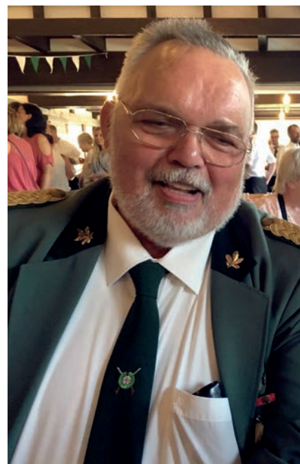
2018 in der Halle

Möppel wurde im Ruheforst in Hilchenbach beigesetzt.