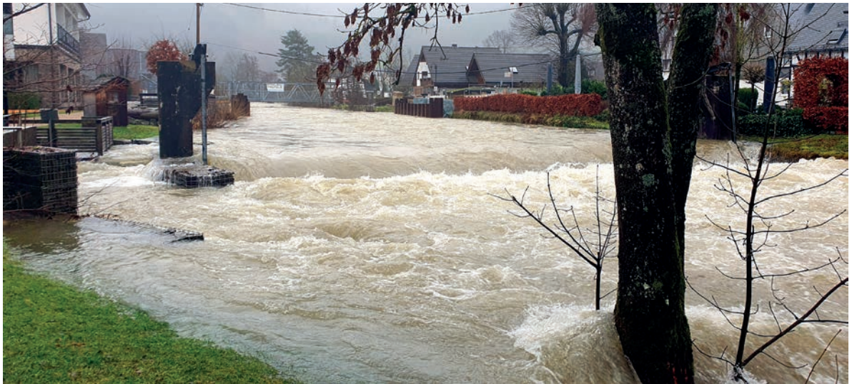
Schlacht und Fischtreppe von Wassermassen überspült, die Lenne floss durch den Park