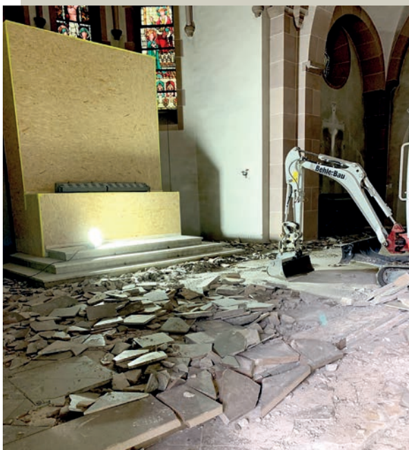
Schutz für den Hochaltar