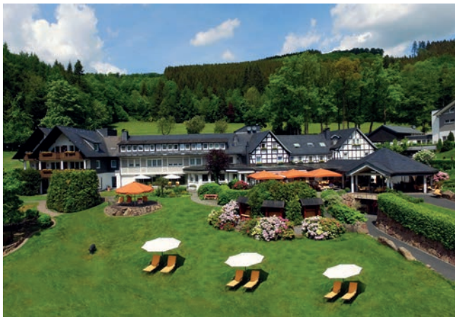
Hotel Haus Hilmeke aus der Vogelperspektive

Seit der Gründung der Pension im Jahr 1924 sind 100 Jahre vergangen und fast jährlich erfuhr das Gebäude Um- und Anbauten, bis der heutige Zustand, aus der Vogelperspektive betrachtet, erreicht wurde.