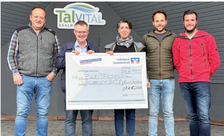
Spendenübergabe - DANKE allen!!