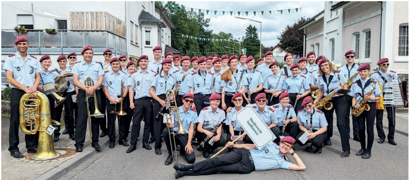
Festzug Kirchhundem 2023