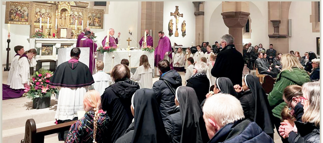
Bis auf den letzten Platz besetzt: Die Kirche bei der Altarweihe am 13.12.2023