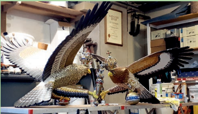
Fertig: Königsvogel (l.) und Jungschützen-Königsvogel