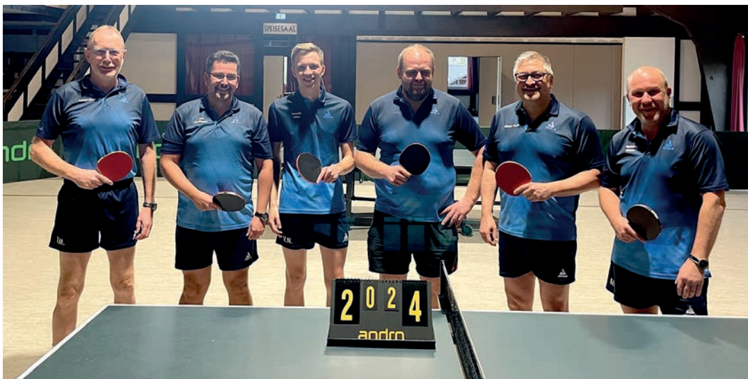
Die siegreiche Mannschaft

Und dass Alter nicht vor Erfolgen schützt, zeigt ein Blick auf die Mannschaftsaufstellung in der vergangenen Saison: