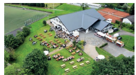
Das Kur- und Bürgerhaus am 17.07.21, offene Probe der neuen Festmusik aus Brachthausen

Durch die Bauweise der Hallendecke, bei der Putz verarbeitet wurde, entsteht eine lange, sogenannte „Nachhallzeit“, die die Akustik problematisch macht. Während die Zuhörer in den ersten Reihen bei Großveranstaltungen mit Wortbeiträgen alles gut verstehen können, kommt immer weniger in den hinteren Bereichen der Halle an. Dieser Umstand wurde von Sachverständigen untersucht, das einhellige Ergebnis war: die Deckenkonstruktion muss radikal verändert werden. Der Verein Freizeitzentrum Saal-