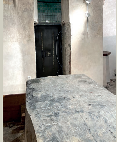
Alte Kirche mit Altar und neuer Tür