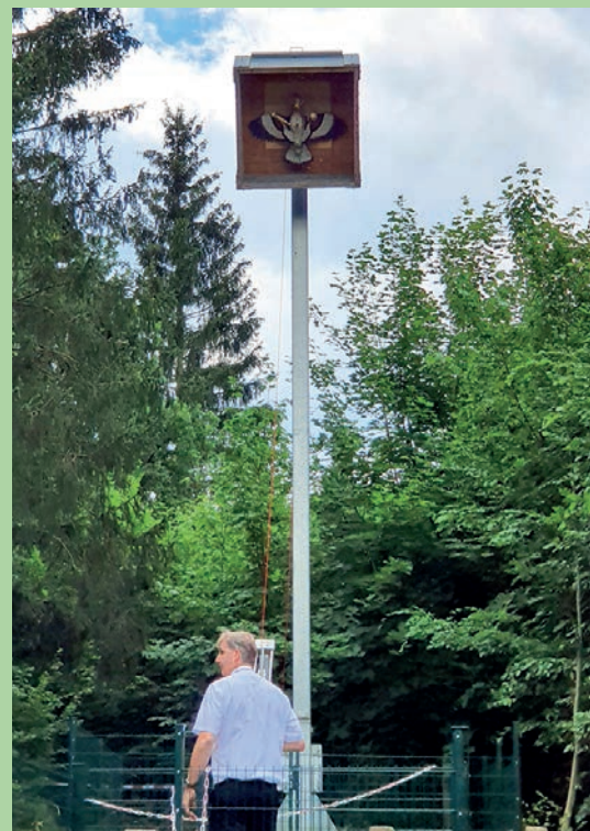
... und Zerlegung