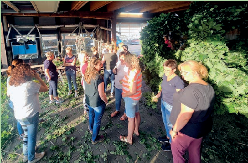
Fertig: Die Eichenlaubkrone für die Hallendecke

Die Resonanz war überwältigend und der Hof war mit Vorstand und Offizieren, Jungschützen, dem aktuellen Hofstaat zum Wickeln des neuen Türkranzes, dem Team, das die Krone gebunden hat, und den Vogelbauern rappellvoll. Alles an einem Ort, alle zusammen in der Präparation unseres Hochfestes.