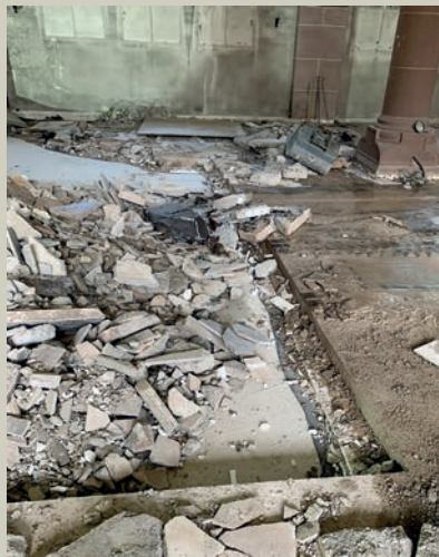
Kein Stein blieb auf dem anderen