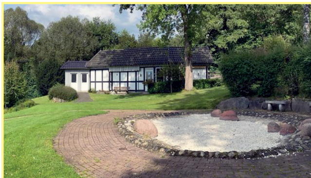
Die Sauna in Saalhausen im Sommer 2023

von 15 bis 18 Uhr. Zusätzlich ist sie am Montag und Mittwoch mit festen Gruppen belegt. Alles in allem eine tolle Auslastung der Sauna, die idyllisch auf dem Gelände des Naturerlebnisbades gelegen ist.