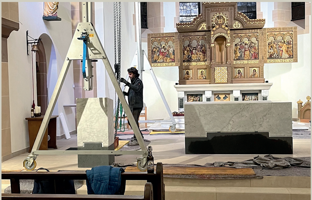
Altar und Ambo werden platziert