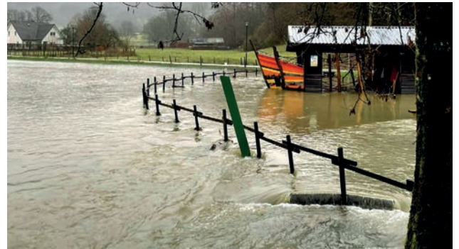
Das Piratenschiff schwimmt!