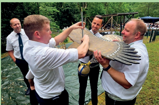
Den kunstvollen Vögeln ist kein langes Leben beschieden