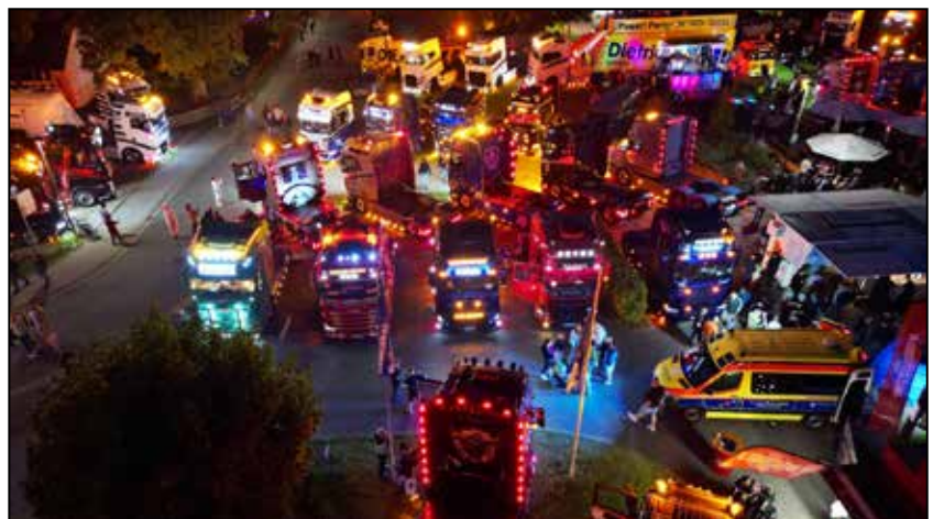
Ein Highlight der Veranstaltung: die nächtlich beleuchteten LKW