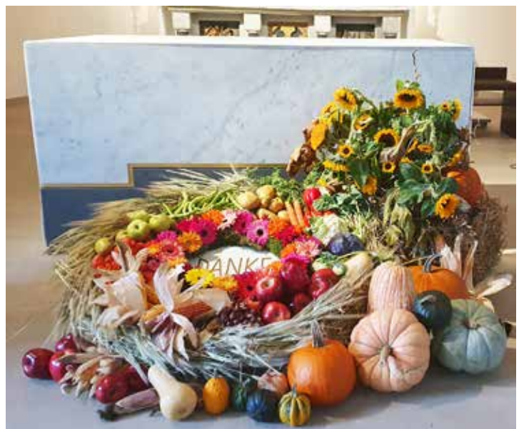
Gabenbild & Krone gestaltet von Sabine Hessmann