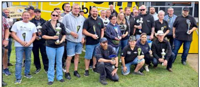
Die Sieger der Truck-Bewertung