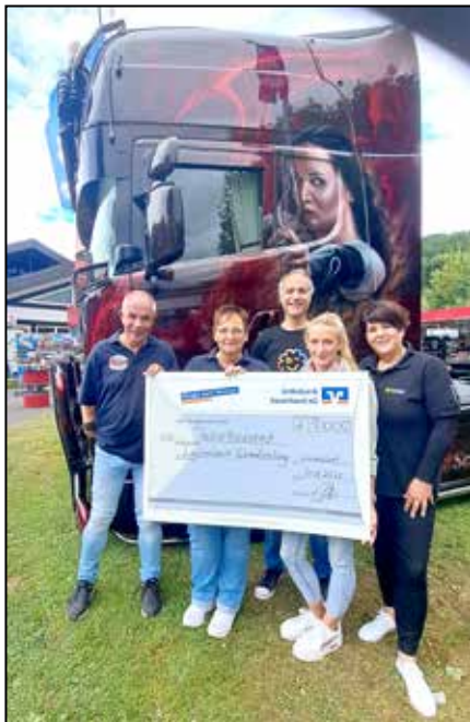
Übergabe von 10.000 Euro an das Lächelwerk in Schmallenberg