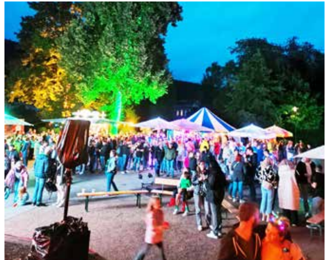
Der gut gefüllte Platz vor dem Pavillon

cher das gastronomische Angebot, sodass keine nennenswerten Reste an verderblichen Nahrungsmitteln übrigblieben. Viele Besucher äußerten sich wie folgt: Diese Veranstaltung könnte für die einheimische Bevölkerung zukünftig wieder wie in den Anfangszeiten stattfinden – „zurück zu den Wurzeln“.