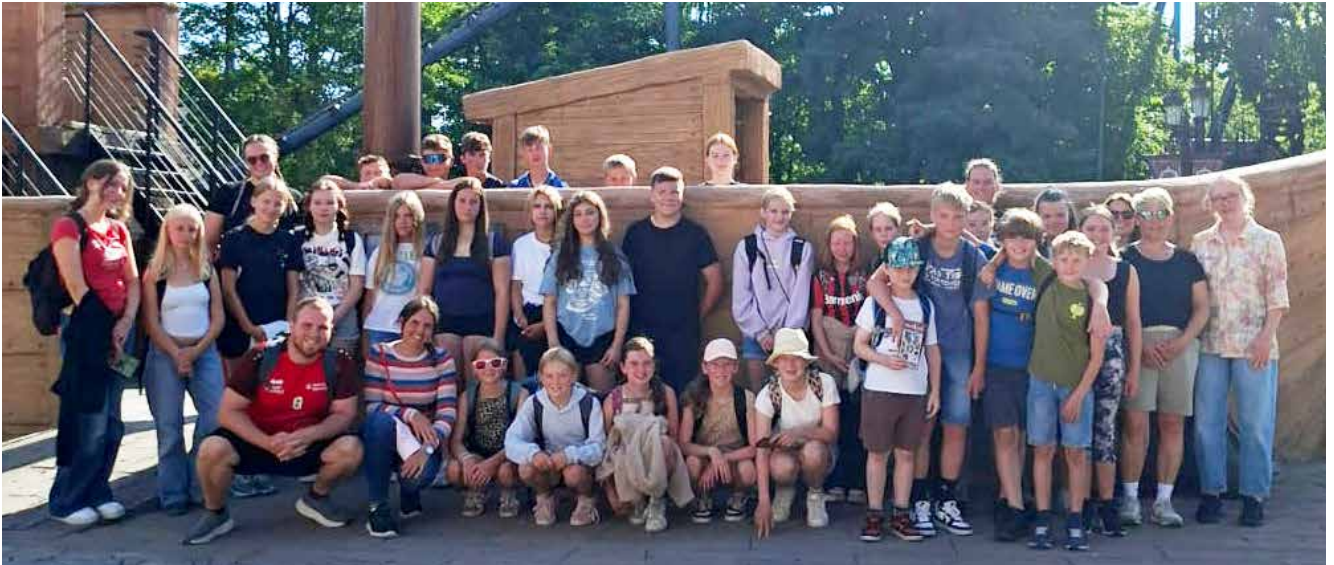
Der letzte Tag im Zeltlager führt die Kinder und Jugendlichen traditionell in den HANSA-PARK