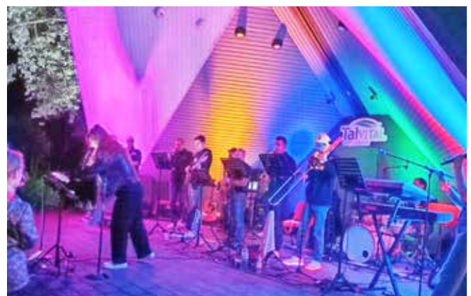
More than Chili: Stimmungsgaranten im Pavillon

AB 18:00 UHR GIBT'S AM PAVILLON MUSIK, KALTGETRÄNKE UND WÜRSTCHEN MIT BROT DER ENTRITT IST FREI! ES WIRD KEINEN WERTMARKENVERKAUF GEBEN (BARZAHLUNG). WIR FREUEN UNS AUF VIELE BESUCHER UND EINEN SCHÖNEN ABEND MIT EUCH!