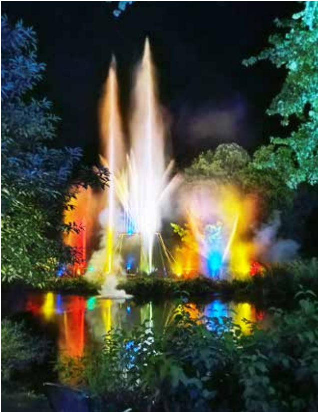
Wie früher: Wasserspiele mit Musik