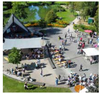
38 10 Jahre TalVITAL