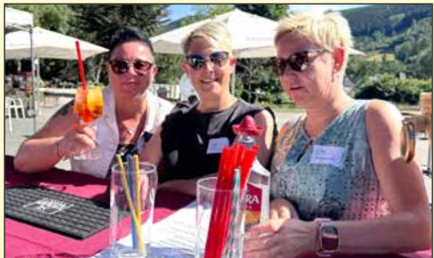
Ob mit Bier oder Cocktail: TalVITAL-Wegbegleiter und Gäste bei bester Laune