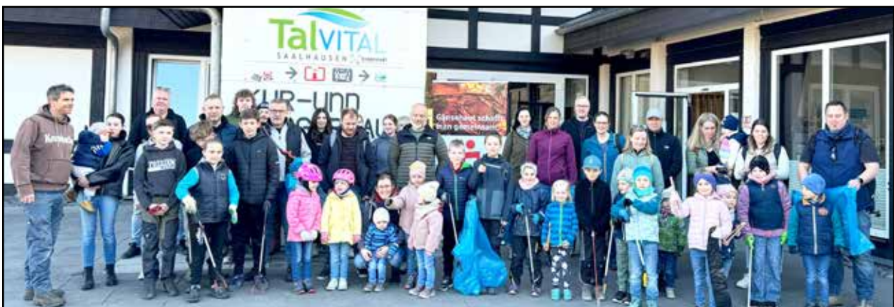
Die fleißigen Helfer am Tag der Sauberkeit

Damit leistet sie einen wichtigen Beitrag zur Förderung von Umweltbewusstsein und Eigenverantwortung schon im jungen Alter. Mit dieser Spende zeigt die Sparkasse einmal mehr ihr Engagement für unsere Region und ihre jüngsten Bürgerinnen und Bürger. Der Verkehrsverein Saalhausen bedankt sich bei den vielen großen und kleinen Helfern recht herzlich.