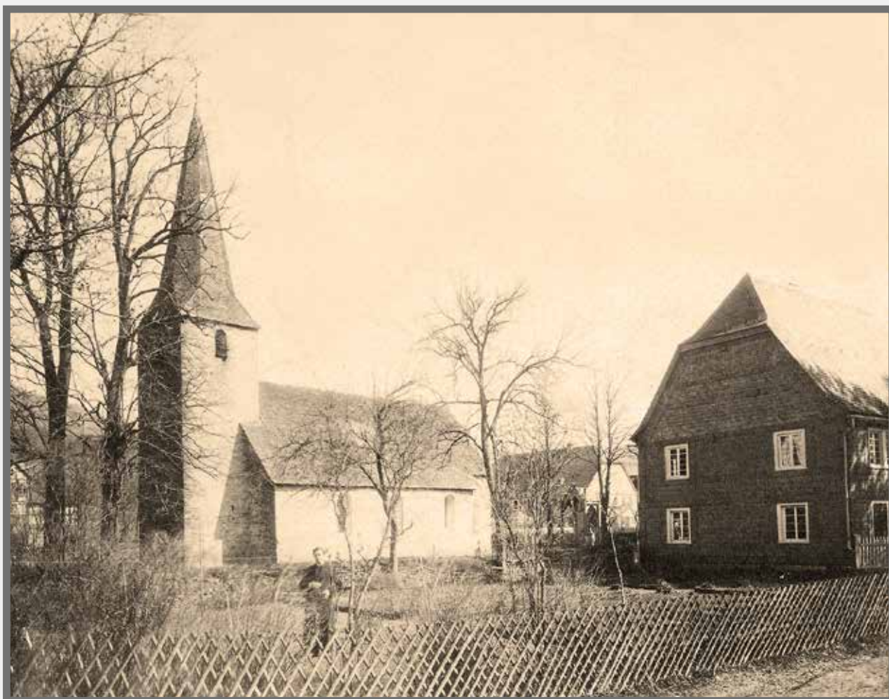
Alte Kirche um 1900