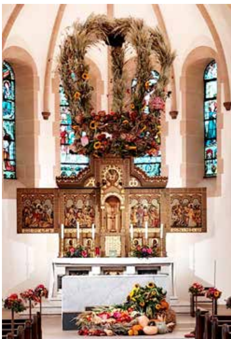
Prachtvoll geschmückt