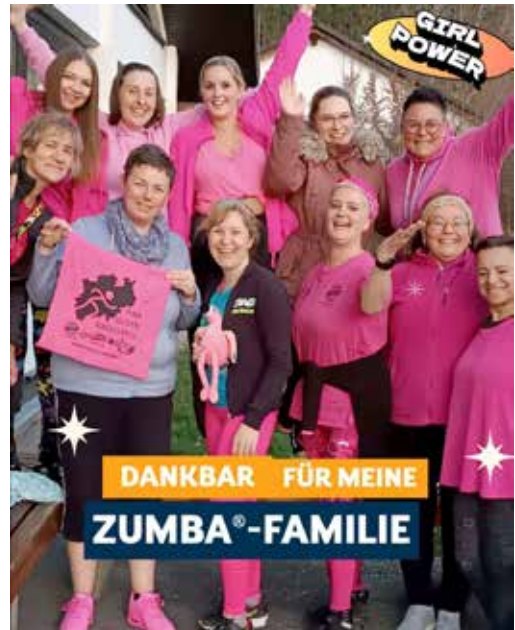
Das Gewinner-Foto: Die Saalhauer Zumba-Familie

„Pink gegen Rassismus“ ist ein Bündnis von Sportverbänden in Nordrhein-Westfalen, das sich seit 2020 aktiv gegen Rassismus im Sport einsetzt. Sportlerinnen und Sportler aller Altersklassen und aus vielen verschiedenen Sportarten beteiligen sich mit Aktionen, die die Farbe Pink in der Öffentlichkeit sichtbar macht, um ein klares Zeichen gegen menschenverachtendes Verhalten zu setzen. Wir auch.