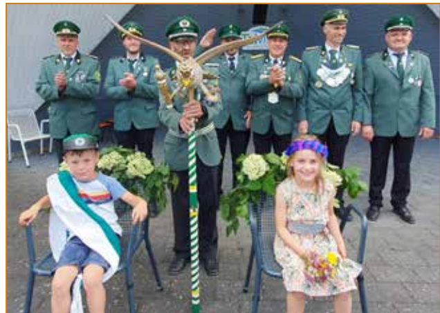
Proklamation im Pavillon