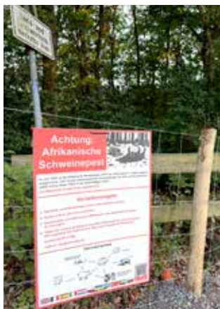
Zaun mit ASP-Warnschild

Anfang Juli begannen die Behörden mit dem Bau von Schutzzäunen um das Kerngebiet, welche die Ausbreitung durch wandernde Wildschweine verhindern sollen. Bis Ende August umfasste die Zauntrasse ca. 45 Ki-