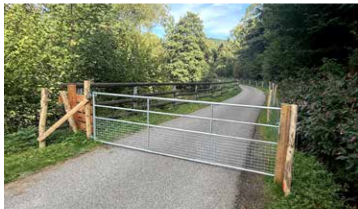
Zauntor an der Lenne in der Nähe des Kurparks