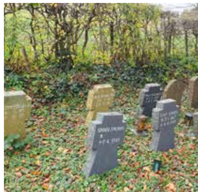
28 Sanierung Kriegsgräberfeld