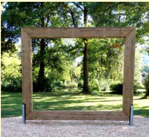
Der TalVITAL-Bilderrahmen

Im Park kamen Mitglieder der Jugendfeuerwehr mit den Besucherinnen und Besuchern ins Gespräch, beantworteten mit viel Begeisterung Fragen rund um das Thema „Feuerwehr“ und luden die Kinder an einem Mitmachstand dazu ein, selbst in die Welt der Feuerwehr hineinzuschnuppern. Offiziell eingeweiht wurde ein neues Highlight im Kurpark: ein Fotospot in Form des TalVITAL-Bilderrahmens. Dieser lädt dazu ein, selbst Teil des Motivs zu werden – Gäste konnten sich darin positionieren und ein originales Erinnerungsfoto „im Bildrahmen“ aufnehmen.