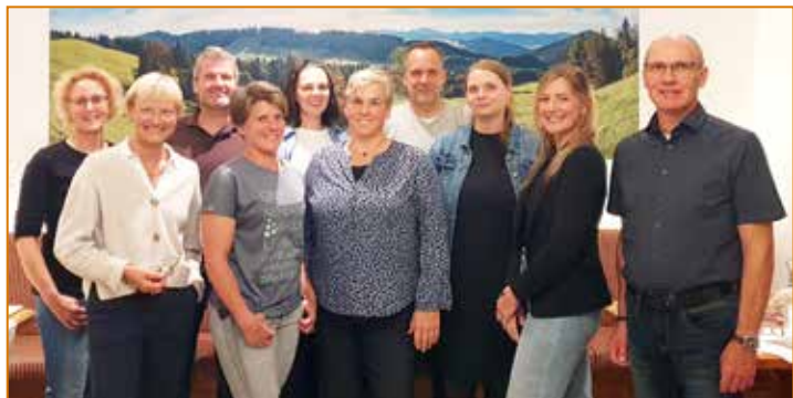
Der alte und der neue Vorstand des Fördervereins

Die Verantwortung für die Betreuungszeit nach Schulschluss übernimmt ab diesem Schuljahr das „Katholische Jugendwerk Förderband e.V. Olpe“. Damit kann sich der Förderverein gezielt auf das konzentrieren, was ihm am Herzen liegt: die Kinder! Der Förderverein blickt voller Dankbarkeit auf die vergangenen Jahre zurück – und voller Vorfreude auf alles, was nun gemeinsam mit Schule, Eltern und Kindern gestaltet werden kann.