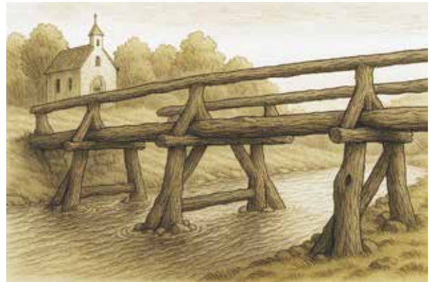
Könnte die Brücke über die Lenne so ausgesehen haben?

Es kann angenommen werden, dass es sich bei dem bearbeiteten Stamm mit zwei Durchbohrungen um ein Holzteil einer Brücke handelt, die um das Jahr 1573 bei der Kirche beziehungsweise Kapelle in Saalhausen gebaut worden ist. Das Holz dieser Brücke wuchs, als Kaiser Maximilian II. über das Heilige Römische Reich Deutscher Nationen regierte, Martin Luthers Lehre das Land veränderte und Königin Elisabeth I. in England herrschte. Während in Europa Religionskriege tobten und in Amerika neue Kolonien entstanden, überquerte man in Saalhausen die Lenne auf einer hölzernen Brücke, von der sich ein Teil – mehr als 450 Jahre später – wiedergefunden haben könnte. Haben wir den Pfosten einer Brücke in Jochbauweise vor uns? Der